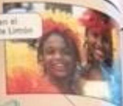
Niñas en el carnaval de Limón