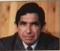
Óscar Arias recibió el Premio Nobel de la Paz en 1987.

Virginia Occidental: West Virginia; mestizo: of indigenous and white parentage; ascendencia: descent; nadadora: swimmer; ejército: army; gastos: expenditures; invertir: to invest; cuartel: barracks