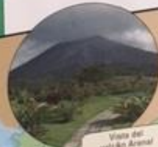
Vista del volcán Arenal