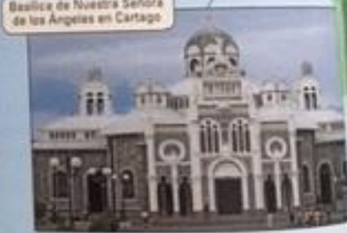
Basílica de Nuestra Señora de los Ángeles en Cartago