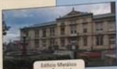
Edificio Metálico en San José