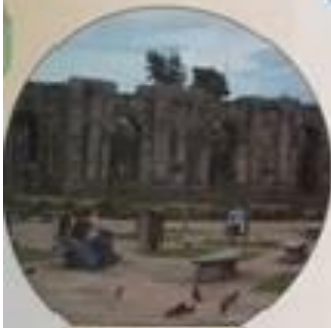
Parque Morazan en San José

¿Qué aprendiste? Responde a las preguntas con oraciones completas.